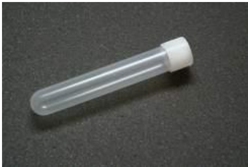
Urin-rör Förrådsartikel, artikelnr: 102308

Blåsinkubationstiden ska om möjligt överstiga 4 timmar. Bäst är prov från morgonurin. Desinfektion eller tvättning av urinrörsmynningen ska inte göras. Ev kan man torka av med steril kompress (på kvinnor i riktning framifrån och bakåt). Vid blödning eller flytning användes tampong. Blygdläpparna hålls isär respektive förhuden dras tillbaka under urineringen. Första urinportionen tas ej tillvara (den spolar rent från ej relevanta bakterier i urinröret). En del av mittportionen uppsamlas i fabriksren plastbägare och 1-2ml urin överförs till rent provtagningsrör med skruvkork. Större volym behövs inte och ett mycket fullt rör är svårt att hantera på laboratoriet. Mycket små volymer kan också skickas, vanligen används mindre än 0,05 mL prov.